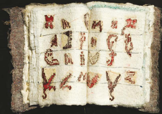
Vzorkovník písma – abecedník, 1999, 18 x 34 x 20 cm, textilná kniha