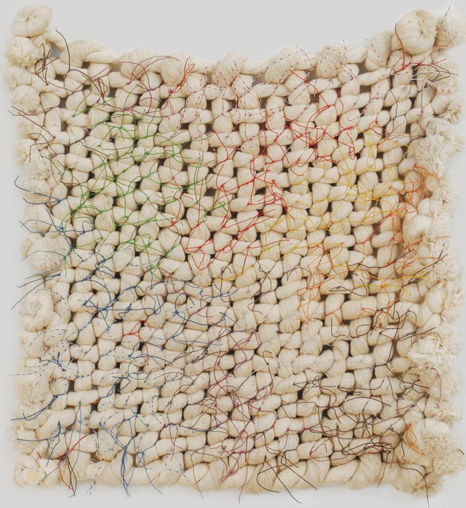
Transparentná tapiséria IV., 1988/90, 70 x 70 cm