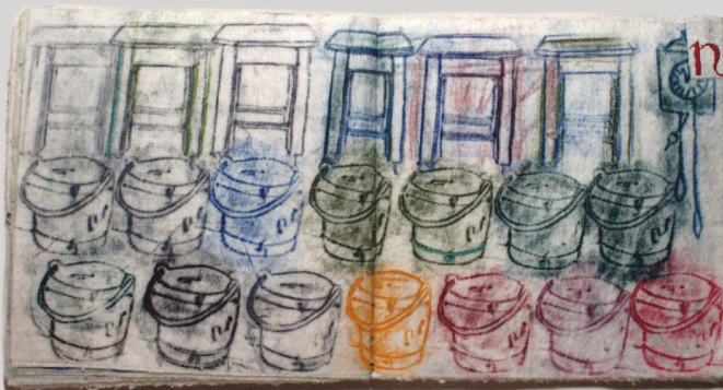
Ženy zblízka a zďaleka, 2017, 20 x 20 x 5 cm, textilná kniha ↑ Nad Považím, 1987/88, 230 x 340 x 5 cm, detaily tapisérie ➔

Vydané pri príležitosti výstavy TKANIE/A/NIE 12. 9. – 24. 11. 2019 Zodpovedný redaktor: Mgr. Michal Jurecký Grafická úprava: Eva Brezániová © Považské múzeum v Žiline, 2019