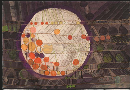
Čerešničky, 1971, 200 x 300 cm, tapiséria

Začiatkom 70. rokov uvádza E. C.-M. ako mladú, ešte „neakademickú“ maliarku na profesionálnu scénu československej voľnej textilnej tvorby jej študentská práca Čerešničky. Táto uvoľnená interpretácia opakujúceho sa prázdninového zážitku z konzervovania sezónneho ovocia je azda najhravejšou autorkinou tapisériou. Zámerne neumelo štylizované čerešničky, miestami sa vtipne „meniace“ na jablko či hrušku, poskakujú po aj pod linajkami fiktívnej školskej tabule a len akoby mimovoľne sa niektoré z nich ocitnú aj na dne zaváracieho pohára.